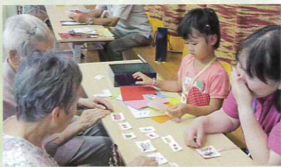
入居者さんのお孫さんや地域の方と夏休みの作業をしました

望海の里の認知症カフェが開設して1年が経ちました。最近のカフェの様子と関わるスタッフのインタビューをご紹介します。