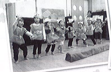
ひなまつり発表会