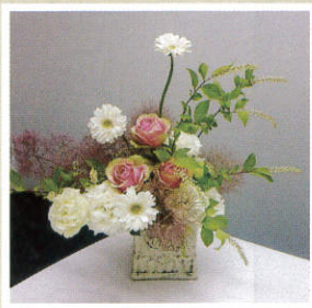
天野 芳子 作

梅雨の季節となり、色とりどりの紫陽花がとても綺麗に咲いています。自然の草花から季節を感じる心、雨や土の香り、蛙の鳴き声など今の季節を五感で感じ、梅雨の時期も楽しく過ごしたいと思います。 さて、今回のレッスンは、この季節しか出回らないスモークツリー、リョウブ、そして、ガーベラ、ばら、トルコキキョウと言った王道の花でのアレンジです。 初めて参加された方の作品ですが、とてもすっきりとした涼しげな、そしてインパクトのあるアレンジができました。 ガーベラの茎の動きを上手く利用し、中心に使うことで大きなポイントになりました。そして花びらを大きく開くガーベラを高低差をつけて生けることは、アレンジ全体を引き締めます。 涼しげなリョウブは、葉を少し間引き、枝のラインと花を強調させました。 又、白い花をブルーピングにする事、ばらとスモークツリーを合わせることで、とても爽やかな印象です。スモークツリーとは、煙の木。モコモコ感で、かなり大きなポリュームのある木ですが、小分けに使う事で他の花を一段と際立たせています。