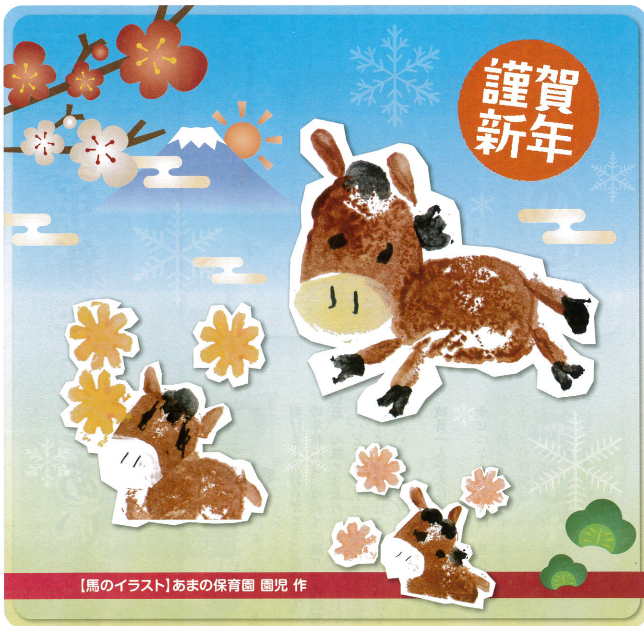
【馬のイラスト】あまの保育園 園児 作